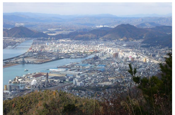
鉢ヶ峰山頂から三原市街を望む ④