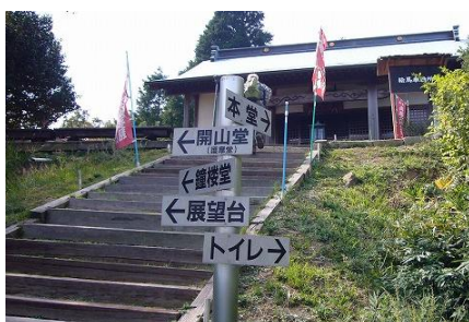
奥之院本堂前階段 ⑤