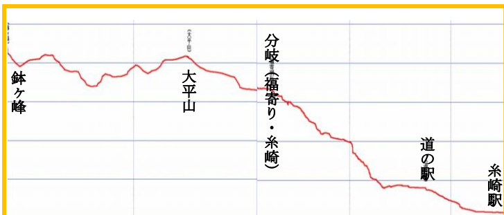
オプションルート(二)の断面図