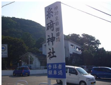
糸崎神社駐車場 ① ①