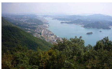
奥之院から尾道方面を眺める ⑤