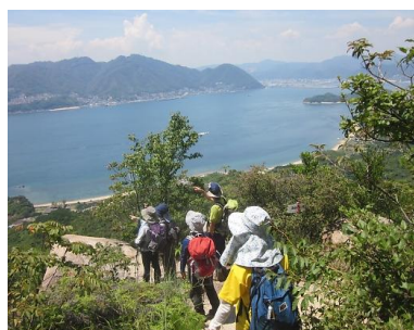
みはらし岩からの眺め ⑬