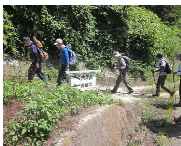
大平山・向田口道標 ②