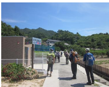
幸神(さいのかみ)登山口 ⑫