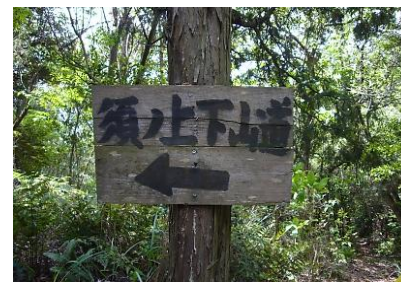
二本松に設置されている 須ノ上下山道標識