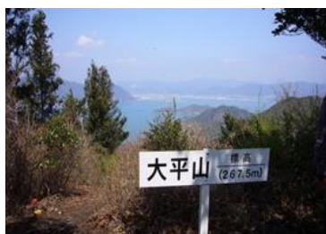
大平山(たいへいざん) ④