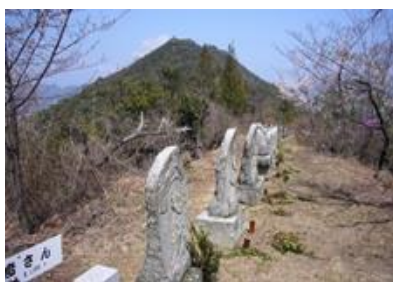
三十三観音 ⑮ (通称:観音さん・背景:大平山)