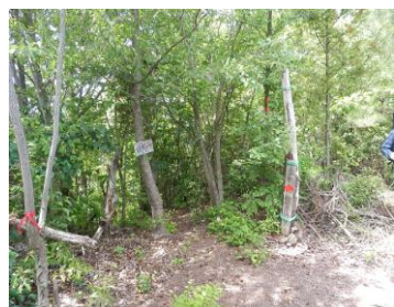
千畳敷上の狗山分岐 ⑤