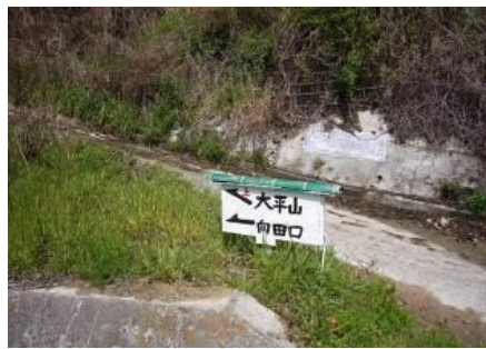
大平山・向田港道標②