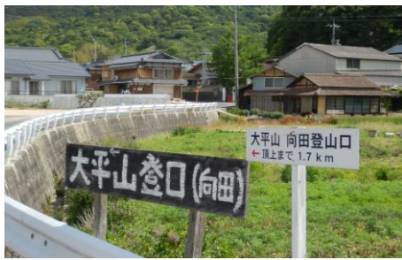
大平山登山口道標 ①