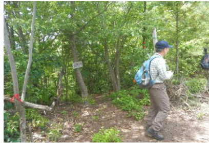
千畳敷上(狗山分歧) ⑤