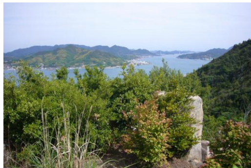
アルペンルート展望台 ⑨